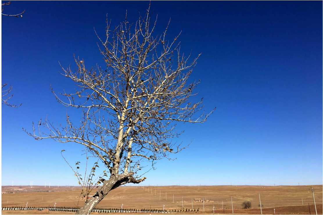
▲ 大青山北麓·呼和浩特武川县